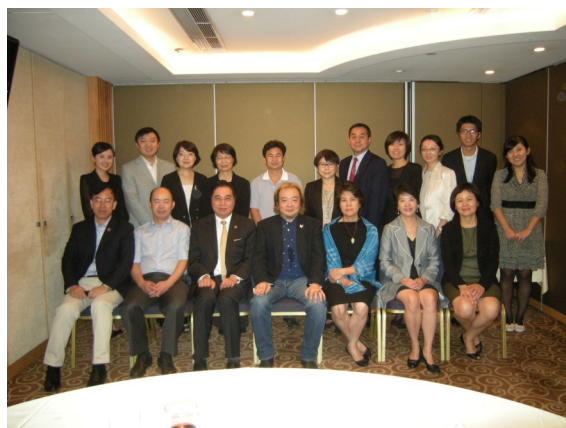
出席同學與北京大學學者合照