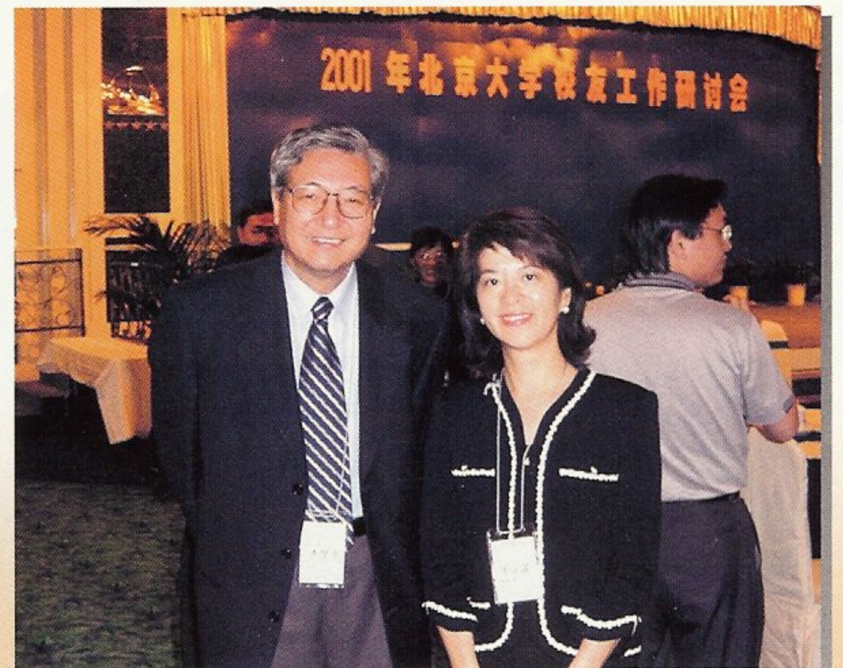
會長與北京大學校長許智宏出席工作研討會