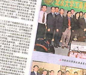
考察團成員在哈爾濱考察期間，與當地官員進行交流。