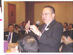
席間同學們勇躍發問