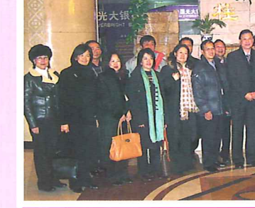
黑龍江省招商局負責人和代表團合影