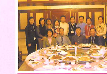
黑龍江省政協，統戰部設宴接待代表團