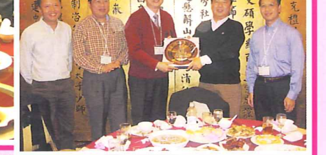
部尚書克禮與考察團成員合影。