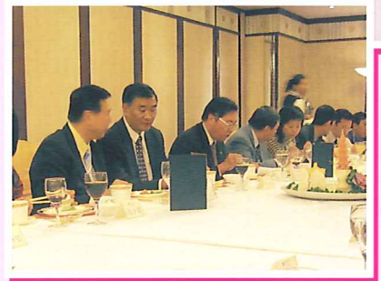
同學於席間與僑聯官員交流

事件的發生祇離出發日期不足數天，成行與否需要作出決定。假若如期成行，未知哈市接待單位能否配合及各團員對健康的顧慮。假若取消或押後行程，很可能在05年內未必可再次安排。理事會真是面對兩難的抉擇。會長在召開緊急會議後決定諮詢各團員意見。豈料各同學全體都一致要求依期出發，反映了各同學對中國及北大的歸屬感蓋過了其他的考慮。