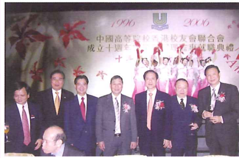
本會同學出席高校聯十週年會慶與韓啟德副委員長(右三)合影