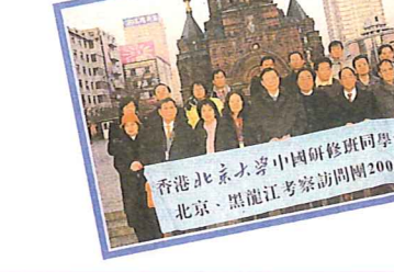
香港北京大學中國研修班同學會 北京、黑龍江考察訪問團2005