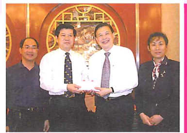
會長代表轉交深造班同學對交流中心之心意

事件的發生祇離出發日期不足數天，成行與否需要作出決定。假若如期成行，未知哈市接待單位能否配合及各團員對健康的顧慮。假若取消或押後行程，很可能在05年內未必可再次安排。理事會真是面對兩難的抉擇。會長在召開緊急會議後決定諮詢各團員意見。豈料各同學全體都一致要求依期出發，反映了各同學對中國及北大的歸屬感蓋過了其他的考慮。