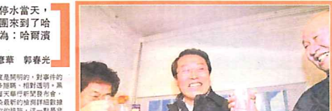
考察團成員在哈爾濱考察期間，與當地官員進行交流。