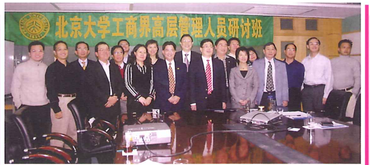
同學在聆聽董險峯教授講論中國五十年經濟回顧後合照。