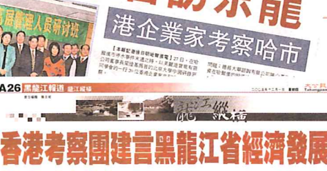
考察團成員在哈爾濱考察期間，與當地官員進行交流。