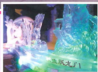
太陽島內之冰雕作品