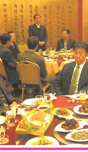
黑龍江省外事辦公室劉主任宴請代表團