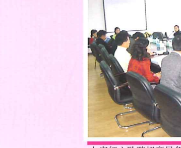
大家細心聆聽招商局負責人介紹當地投資情況