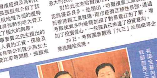
省長喝第一口水，我們怕什麼？