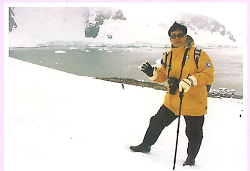
林光如攝於南極洲

我們的先人從中原遷徙到南方，近代更衝出圍籠邁向世界，吸收海洋文化，培育了黃遵憲、丘逢甲、葉劍英、李光耀和他信這些仁人志士或國家棟樑。這些客家人敢做敢為、勇於犯難的精神，令我由衷敬佩。正是在客家精神的感召下，我鼓起勇氣參加這次南極生態考察。當天，我踏上南極大陸的第一句話就是：「感謝上蒼，讓我這個客家人來到了南極這塊聖潔的大地！」